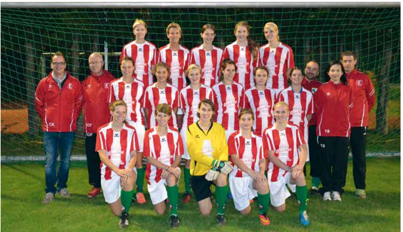
Die Fußball-Damenmannschaft des VfL Eintracht Hannover

Ganz egal, ob es die Unterstützung vom Verein selber ist, wie Vereinskleidung oder die ausgesprochen starke Jugendförderung, oder unsere Fans und die Motivation der anderen Mannschaften neben dem Platz als 12. Frau, sowie das Ausheilen unserer starken B-Mädels, es wird viel für den Erfolg getan. Natürlich profitieren wir auch davon, zwei Trainer, einen Konditionstrainer und einen Betreuer in unse-