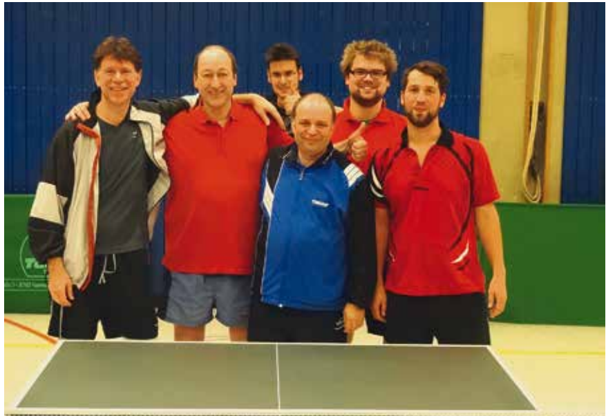
Die 2. Mannschaft spielt zurzeit in der Kreisliga um den Aufstieg mit

Die 4. Herren und die 5. Herren spielen in der 1. Kreisklasse. Die vierte Herren hat noch kein Spiel gewinnen können. Für die fünfte sieht es mit einem Sieg und einem