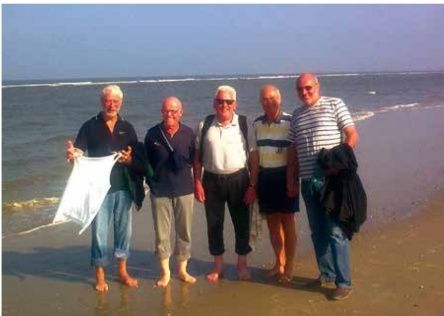
... und am Strand von Borkum