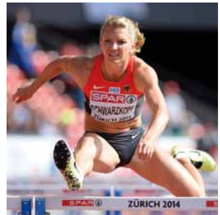
100 m Hürden

den Lilli mit zufriedenstellenden 13,87 Sekunden gut absolvierte. Glänzend verlief der Hochsprungwettbewerb. Hier übersprang sie 1,85 Meter und scheiterte an 1,88 Meter nur knapp. 1,85 Meter waren persönlich Bestleistung und zugleich Vereins- und LGH-Rekord. Eine Punktausbeute von 1.041 erbrachte für sie den höchsten Wert in diesem Wettkampf. Nach dem Hochsprung wurde der 6. Rang