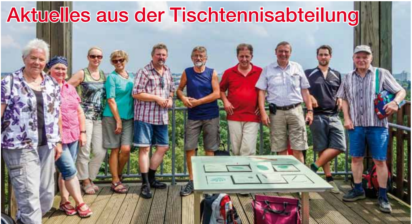
Vom Baumhaus in der Waldstation hat man einen tollen Blick auf Hannover und Umgebung

Die Saison hat erst nach den Sommerferien begonnen. Wir nehmen mit sieben Mannschaften im Erwachsenenbereich und vier Mannschaften im Jugend/Schülerbereich am Punktspielbetrieb teil.