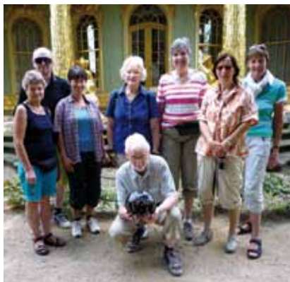
Chinesisches Haus im Park Sanssouci

Am 7. August 2014 fuhren wir mit 8 Teilnehmern wiederum mit der Bahn nach Berlin-Spandau. Diesmal ging es in südliche Richtung in den Grunewald. Nach gut einer