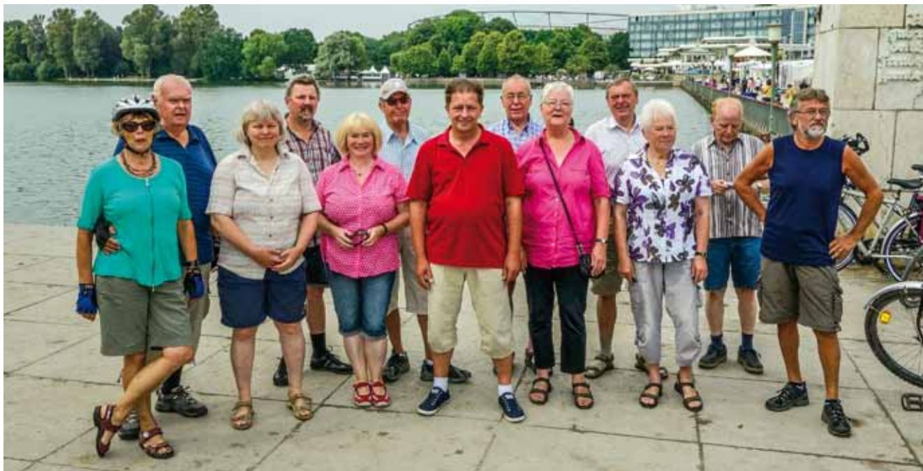
Am Anfang der Radtour – einige fehlen noch