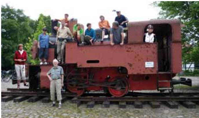
Museumslok Landgut Borsig

zu DDR-Zeiten fast verfallen war, wurde es ab dem Jahre 2000 restauriert und zu einem modernen Veranstaltungs-/Restaurant- und Hotelkomplex umgebaut, wobei die historischen Gebäude, u.a. das im spätklassizistischen Stil gebaute Verwaltungsgebäude, weitgehend verwendet wurden. Der tolle äußere Gesamteindruck wurde leider durch einen schlechten Service beim Abendessen etwas getrübt.