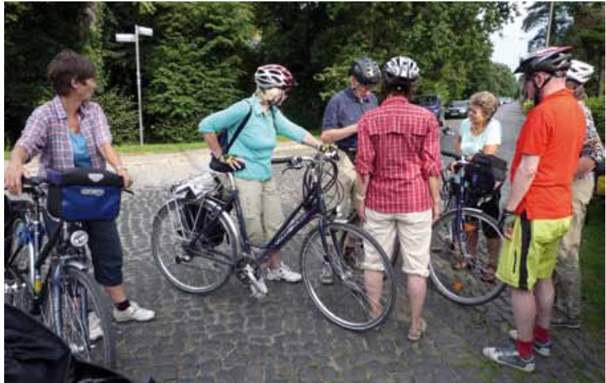
Unterwegs beim Kartenstudium

Stadtschloss von Potsdam (Sitz des brandenburgischen Landtages) und kamen durch das Brandenburger Tor (das gibt es nicht nur in Berlin) in den Park Sanssouci mit dem Schloss, dem Chinesischen Haus und dem Neuen Palais. Danach radelten wir vorbei an der Orangerie zur russischen Siedlung Alexandrowka und der russisch-orthodoxen Kirche. Den Abschluss der Historien-Tour bildete das Belvedere auf dem Pfingstberg. Bevor wir nun etwas Ruhe genießen konnten, mussten wir ca. 5 km entlang der vielbefahrenen Bundesstraße 2 radeln. Entlang der Ufer von Lehnitzsee und Jungfernsee radelten wir auf schönen Waldwegen und entdeckten immer wieder kleine Sandbuchten für kurze Rastpausen und zum Genießen. Das nächste Historien-Highlight war die Heilandskirche von Sacrow. König Friedrich Wilhelm IV ließ sie im Jahre 1844 im italienischen Stil erbauen, sie liegt direkt am Ufer von Havel und Jungfernsee und man könnte mühelos zum anderen, westlichen Ufer schwimmen. Daher war das Kirchengelände von 1961 bis zur deutschen Wiedervereinigung Sperrgebiet, um Fluchtversuche zu vermeiden. Nachdem sie in der Zeit zusehens verfiel, wurden in den Jahren 1984/85 durch eine Rettungsaktion der „Stiftung Tagesspiegel“ und des Westberliner Senats Dach und Außenfassade