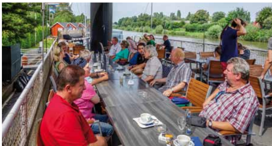
Zwischenstop am Mittellandkanal im „Schiffrestaurant“

*) bei Punktspielbetrieb nur eingeschränktes Training