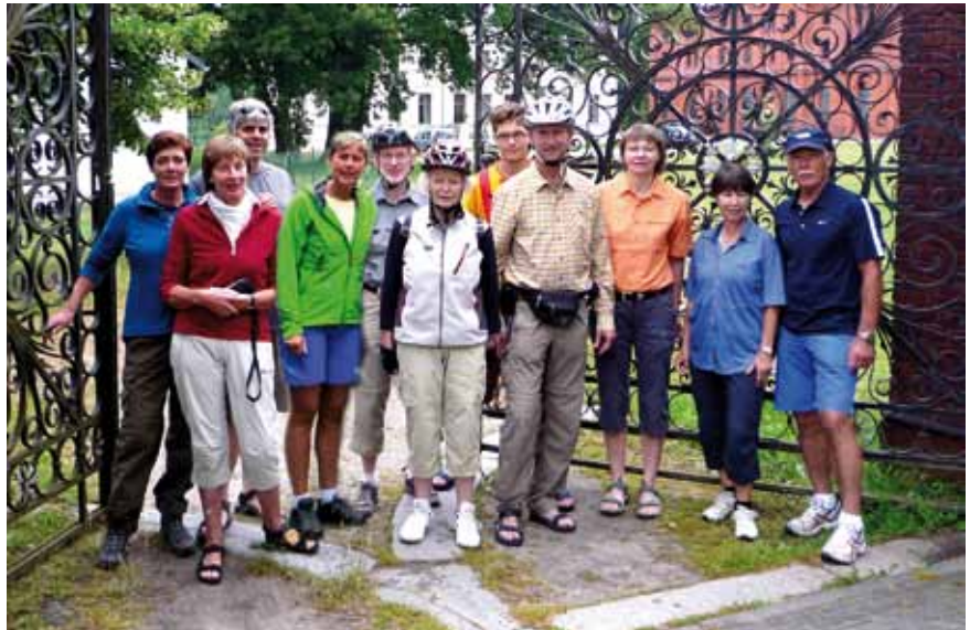
Vor dem Tor Landgut Borsig

Die erste Gruppe fuhr am 28./29. Juni 2014 mit 11 Teilnehmern eine Tour im Havelland. Dazu ging es zunächst mit den Fahrrädern mit der Bahn von Hannover nach Berlin-Spandau. Von dort wollten wir den Havel-Radweg ca. 15 km in nördliche Richtung fahren. Aber im Stadtgewimmel den Einstieg in den Radweg zu finden, gestaltete sich etwas schwierig. Nach ca. 20 Minuten waren wir aber eindeutig auf dem richtigen Weg und es ging zügig voran. Gegen 13.30 Uhr war langsam die Mittagsrast fällig, im Restaurant „Skipper“ im Yachthafen von Nieder-Neuendorf. Danach ging es in westliche Richtung auf den Havelland-Radweg. Ein wunderbarer Radweg, nur Asphalt und viel Landschaft, Landschaft. Wir kamen gut voran und erreichten nach ca. 45 km den Ort Ribbeck, der natürlich noch jedem aus der Schulzeit durch das Gedicht des