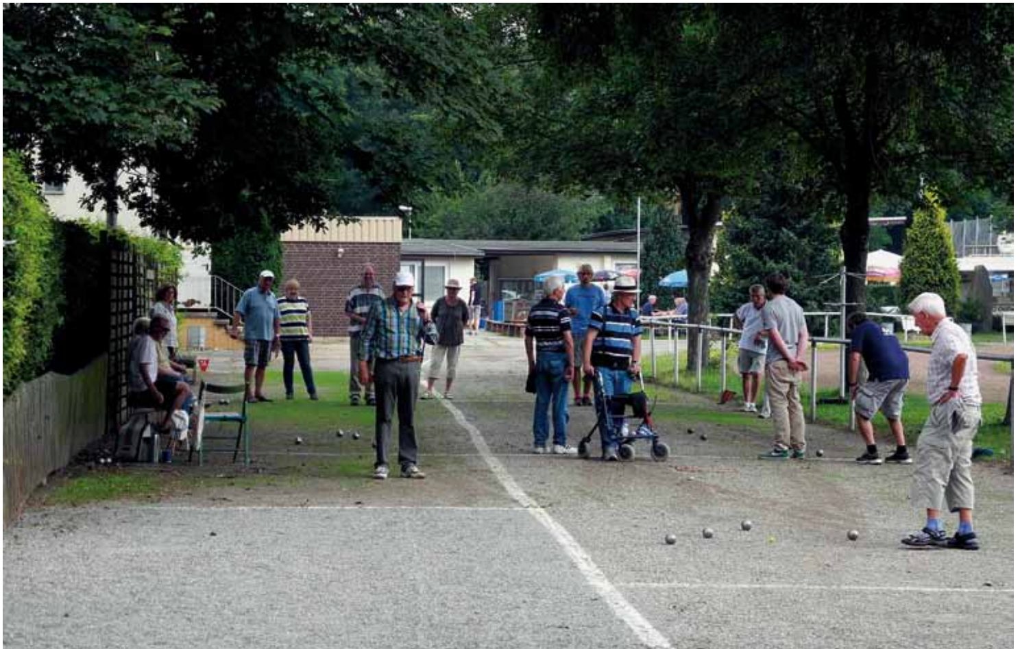
Reges Treiben bei den Spielen der Petanque-Abteilung auf der Spielfläche neben den Umkleidekabinen beim VfL Eintracht Hannover. Übrigens: Die Petanque-Abteilung sucht dringend Nachwuchs für ihren Sport

Neuer Geschäftsführer beim VfL Eintracht Hannover Seite 3