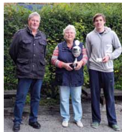
Die Sieger des Wolfgang-Fechner-Pokal

Vor der Schlussetappe am 04.10.14 müssen noch 2 Etappen nachgeholt werden, die seinerzeit wegen schlechtem Wetter ausgefallen waren. Wir werden berichten. H.M.