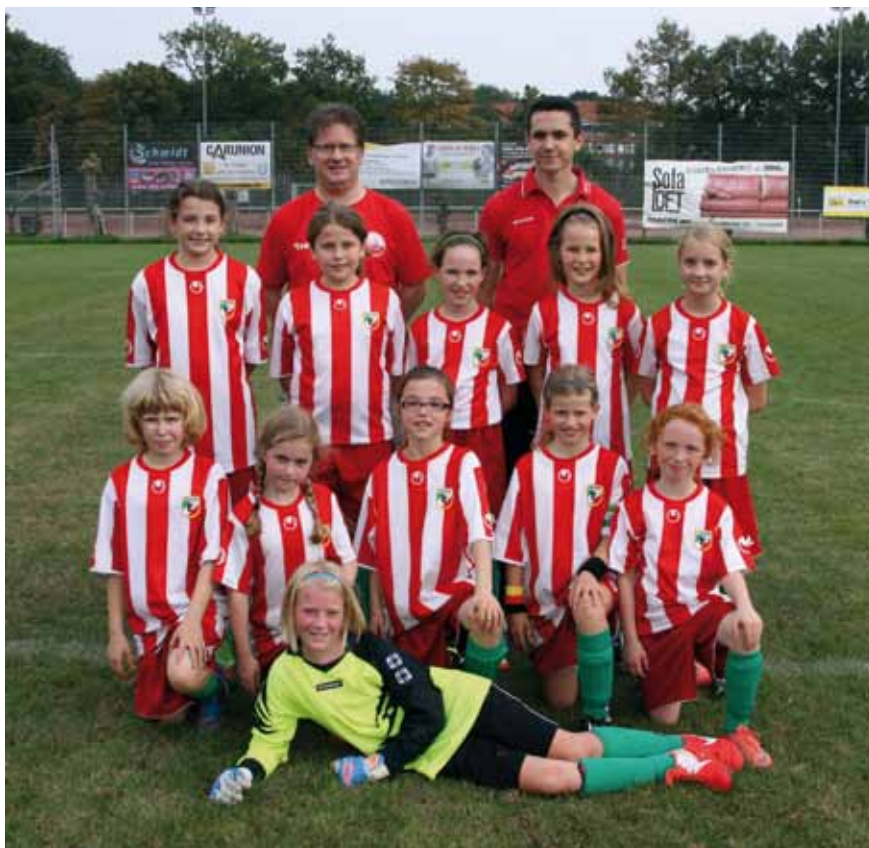
Die neu formierten E-Juniorinnen des VfL Eintracht Hannover