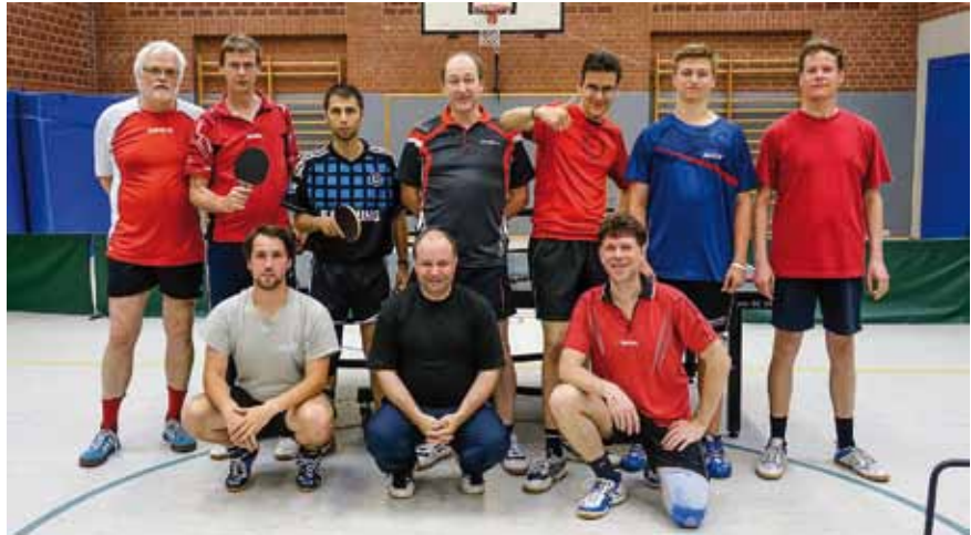
Die Teilnehmer der Vereinsmeisterschaft im Einzel (von links stehend bis rechts kniend):

Redaktionsschluss Ausgabe 3-2014 22. September