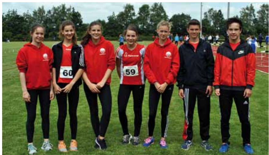
Die erfolgreichen Athleten