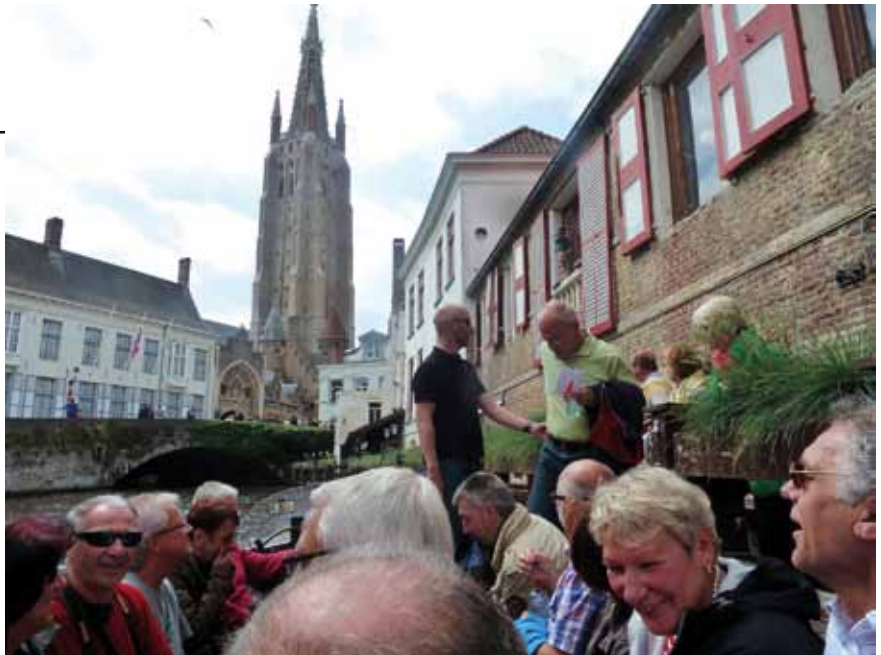
Reiseorganisator beim Anheuern zur Bootsfahrt in Brügge

Wie auf der Hinfahrt ging es auch dann ohne Stau zurück nach Hannover. Bei der Rückreise wurden bereits Überlegungen angestellt, welches Ziel wir – hoffentlich