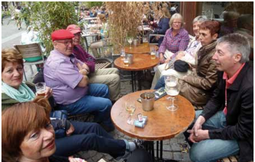
Die Gruppe beim Probieren belgischer Biersorten

weiter alle zusammen und gesund – im Jahr 2016 ansteuern werden. Einigkeit bestand schon jetzt darin, erneuert einen Bistro-Bus zu mieten. R.J.