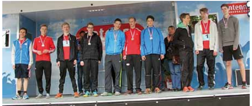
Männliche Jugend U20/18 gewinnt Silbermedaille