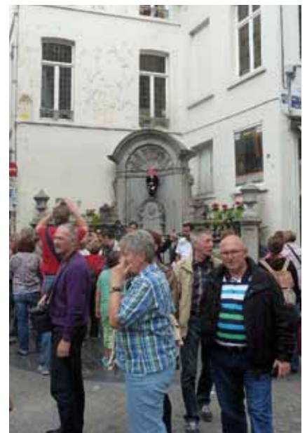
Touristischer Andrang vorm Menneken Piss

Am zweiten Reisetag haben wir Brügge und Gent besichtigt. In beiden Städten gab es dann jeweils einen geführten Stadtrundgang. Brügge hat uns alle aufgrund seiner Baulichkeiten begeistert. Ähnlich ist es uns in Gent ergangen. Am Abend kehrten wir zurück nach Brüssel. Dort haben wir uns in mehreren Gruppen erneut zu Fuß in