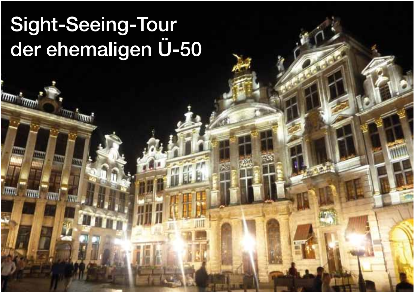
Abends in Brüssel

Bei der Ü-50 handelt es sich um ehemalige Fußball-Spieler des Vereins. Sie haben über Jahrzehnte vom Herren- bis in den Seniorenbereich nahezu in gleicher Besetzung zusammen Fußball gespielt. Viele von ihnen kennen sich bereits seit der Jugend. Der Kreis ist bis heute freundschaftlich miteinander verbunden. Dies spiegelt sich unter anderem darin wieder, dass die Mannschaft nebst Ehefrauen bzw. Lebensgefährtinnen im Zweijahres-Rhythmus eine mehrtätige gemeinsame Reise unternimmt.