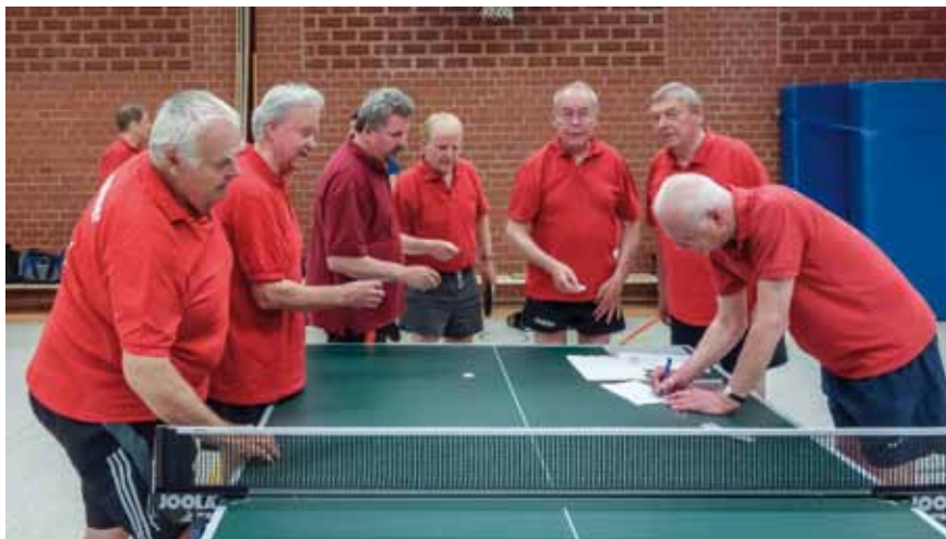
Die Spannung steigt, wer wird mein Doppelpartner?