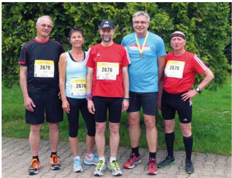
Am Montag nach dem Marathon fünf der Staffel-Teilnehmer beim Laufftreff

Der Laufftreff startet immer montags um 18:00 Uhr und freitags um 17:00 Uhr, mit Treffpunkt vor der Vereinsgaststätte und ist cirka eine Stunde unterwegs.