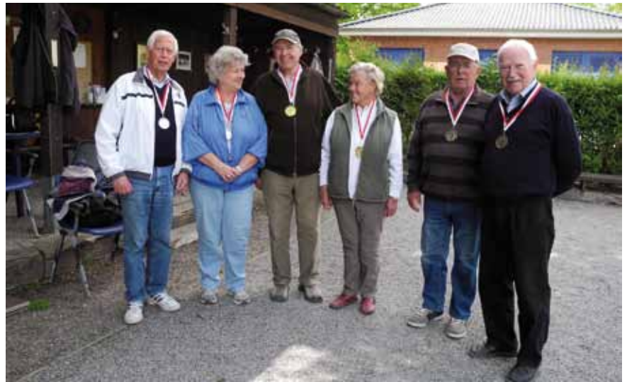
Doublette-Meisterschaft die 3 besten Doubletten