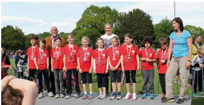
Die stolzen Sieger