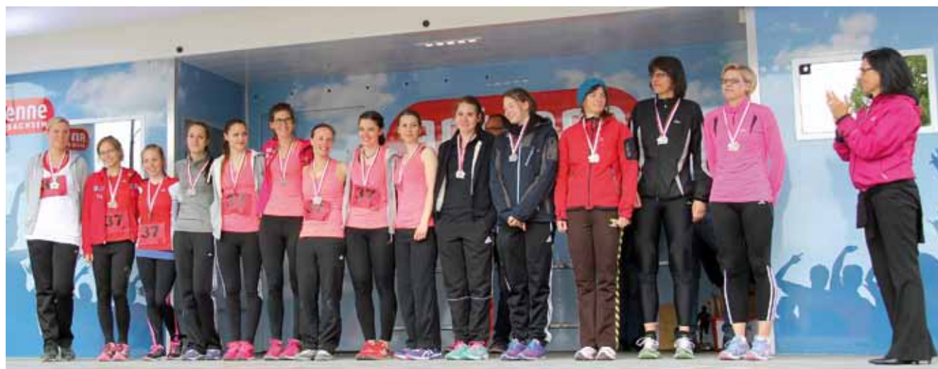
Gemeinsam stark: Weibliche Jugend, Frauen W 20 und Seniorinnen W 40 freuen sich über den Silberrang des Rundstaffelwettbewerbes