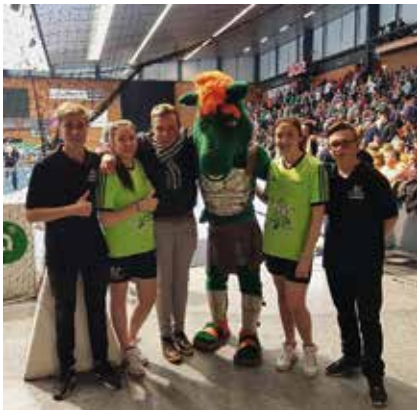
Tiger, Marcel und Alex beim Handball

Noch ein kurzer Blick zur Meisterschaft.