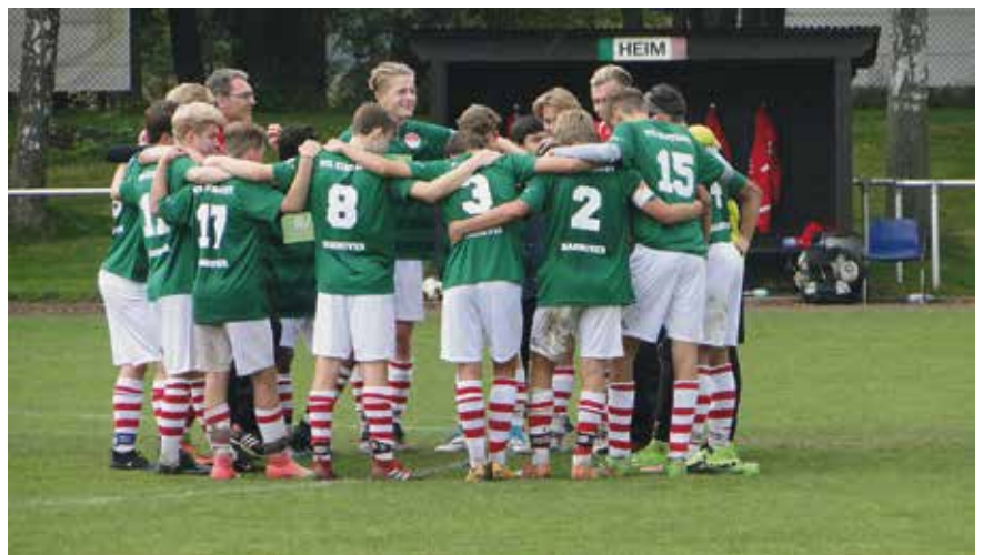
Wir „halten“ zusammen