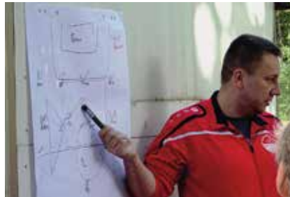
Vorbereitung: Taktiktafel und Turnier

Nicht unvorbereitet: Dem Liga-start vorgeschaltet war am Ende der Sommerferien ein Turnier beim TSV Krähenwinkel in Langenhagen. Dort zeigten alles in allem ansprechende Leistungen, dass großes Feld und große Tore nicht schrecken müssen. Noch klarer wurde