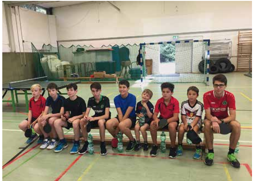
Die Teilnehmer des TT-Trainingslagers Clausthal-Zellerfeld 2017

Hier noch die Zwischenstände aus dem Punktspielbetrieb. Die