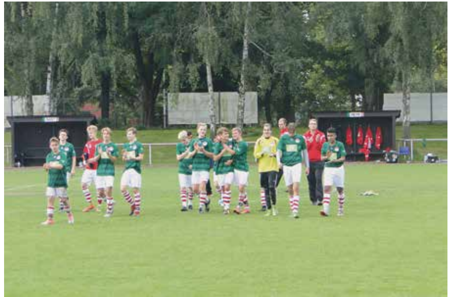
Wir auf der Ehrenrunde

nicht wirklich aussagekräftig. Sicherlich werden nur wenige Punkte am Ende entscheiden. Wir werden in jedem Fall alles geben, um Ende Mai die nötigen Punkte mehr als unsere Konkurrenten auf dem Tableau zu haben! Weiter sind wir auch im Pokalviertelfinale und freuen uns auf die Auslosung – ein Heimspiel wäre toll!