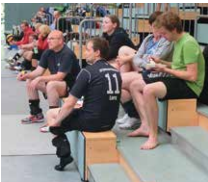
Pause zwischen den Spielen

Alle hatten bereits Sand unter den Füßen waren auf die beginnende Beach-Saison ausgerichtet. Aber unverhofft kommt oft – da außer dem Regionsmeister VFB Hannover alle anderen Mannschaften auf ihr Startrecht verzichteten, durften wir spontan die Region Hannover bei den Landesmeisterschaften am 06./07.06.2015 in Wolfenbüttel vertreten. Mit viel guter Laune und ohne große Vorbereitung traten wir mit einem Mix aus den drei Mannschaften an. Gleich zum Auftakt der Vorrunde am Samstag morgen wartete der vermeintlich „dickste“ Brocken, der spätere Landesvizemeister, das Team Schaumburg. Trotz der anfänglichen Abstimmungsprobleme ein enges Spiel zweier