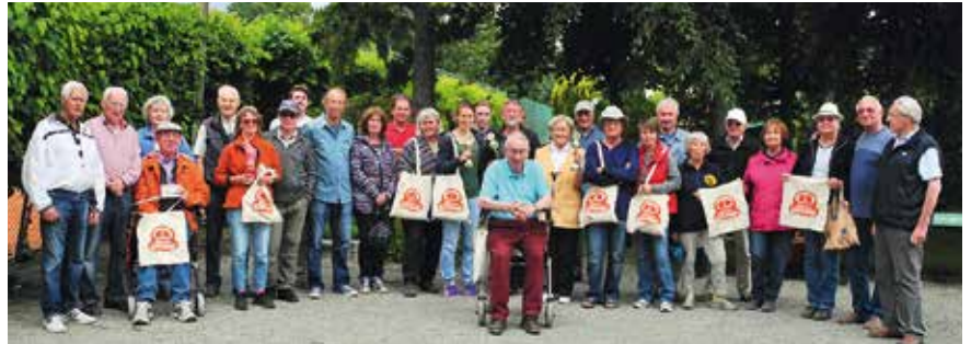
Spielerinnen und Spieler des Bäcker Göing Turniers

Am 1. August hatten wir unser tête-à-tête, das ist unsere Vereinsmeisterschaft im Spiel 1 gegen 1.