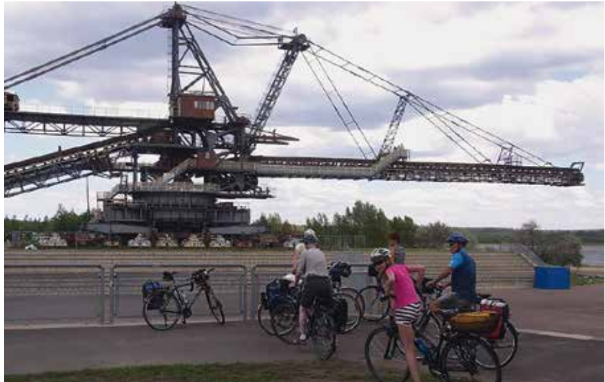
Großer Bagger Ferropolis

Die Lutherstadt Wittenberg steckt voller Historie. Wir erleben dies bei einem Spaziergang am Sonntagmorgen durch den mittelalterlichen Stadtkern. Die bekannten Persönlichkeiten der Reformation wie Martin Luther, Philipp Melancthon, die Maler Lucas Cranach der Ältere und der Jüngere begegnen