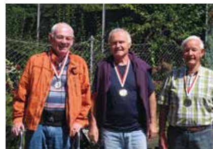
Die drei Besten im tête-à-tête