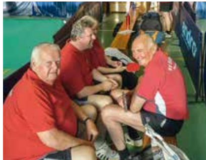
Die Stimmung zum Vergleichswettkampf war sehr gut

Für den Spielbetrieb der Erwachsenen haben wir in der neuen Saison wieder sieben Mannschaften gemeldet. Wir starten von der 2. Kreisklasse bis zur 2. Bezirksklas-