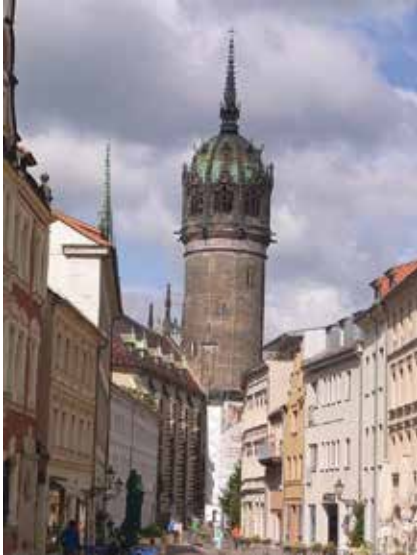
Turm Schlosskirche Wittenberg

Bei der zweiten Tour fuhren wir mit 10 Teilnehmern der Freitagsgruppe „Kondition und Spiele“ der Südstadtschule am Wochenende 25./26. Juli 2015 mit der Bahn nach Bitterfeld und radelten von dort zunächst entlang des Großen Goitzschesees und weiter zum Gremminer See mit der Stadt aus Eisen Ferropolis (mehr dazu später) und am Nachmittag weiter nach Wittenberg an der Elbe. Es ist der Samstag mit dem Sommerorkan, glücklicherweise kommt der Wind weitgehend von hinten, in den Böen erreichen wir (ohne zu treten) Geschwindigkeiten von über 30 km/h. Am Sonntag geht es über Wörlitz (Mittagsrast) nach Dessau und von dort mit der Bahn wieder nach Hannover.