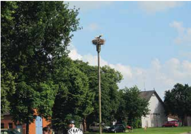
Storchennest im Rundling Luckau

weiter, kam aber nach kurzer Zeit zurück. Als nächstes konnten wir zwei sehr sportliche Herren in das Lokal lotsen. Danach kamen noch etliche Fahrradfahrer vorbei, auch sie ließen sich die Gelegenheit nicht entgehen. Langsam hatte der Wirt keine Stühle und Schattenplätze mehr (dafür machte er aber das Geschäft des Tages). Für uns war es aber auch langsam Zeit weiterzuradeln, sodass wieder 7 Plätze frei wurden. Auf dem weiteren Weg nach Hitzacker kamen wir noch an den Elbterrassen von Wussegel vorbei und gönnten uns Eiskaffee und Eisbecher.