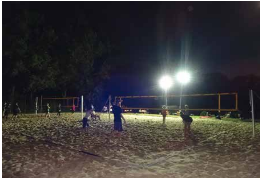
Das Spiel gegen das Licht

Am 29.08.2015 fand zum ersten Mal das Nachtbeachturnier des VfL Eintracht statt. Das Konzept des Turniers ist ähnlich dem unseres allseits beliebten Kuddel-Muddel-Turniers – Mitspieler aus allen Mannschaften des VfL treten in mehreren Runden in jeweils bunt zusammengewürfelten Teams gegeneinander aus – nur dass wir die Halle dieses Mal gegen unsere Beachanlagen eintauschten, die Nacht zum Tag machten und zu viert statt zu sechst auf dem Sand standen. Mit Spannung wurde der