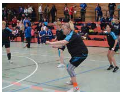
Warten auf den Angriff

Dummerweise ging es den Gadderbaumerinnen in ihrem Kreuzspiel gegen den TV Grohn gleicher-