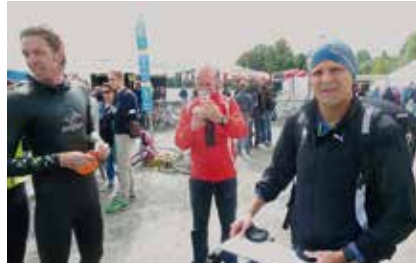
Vor dem Start