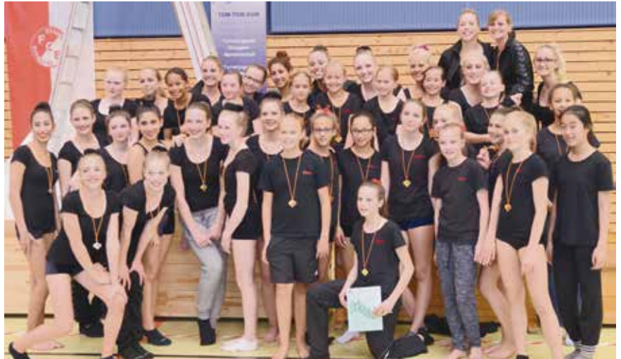
Die 4 Mannschaften bei den Landesmeisterschaften in Lengede

Für unsere Jüngsten begann der Wettkampf um 07.30 Uhr mit dem Schwimmen. Nach dem kurzen Einschwimmen waren sie putzmunter und topfit und konnten ihre Leistungen vom Training noch übertreffen und erschwammen sich die höchste Punktzahl aller Mannschaften. Während sie sich vom Schwimmbad auf den Weg in die Wettkampfhalle machten, begann für unsere TGM Erwachsenen das Eintanzen, denn sie eröffneten den gesamten Wettkampf um 10.00 Uhr in der Halle. Nun nahm der Wettkampf bei strömenden Regen seinen Lauf, was ja beim Turnen, Tanzen und der Gymnastik nicht so schlimm war, allerdings gehören zu dem Vielseitigkeitswettkampf unter anderem auch noch Staffellauf und Medizinballweitwurf. Unsere jüngsten (SGW 2 10 – 14 Jahre) erzielten in allen Disziplinen jeweils die Höchstwertung in ihrer Wettkampfklasse. Ebenfalls schafften dies auch unsere TGM Erwachsenen (18 und älter). Sie erhielten für ihre neue Turnübung sogar die Tageshöchstwertung. Die VfL Eintracht Mannschaft in der Wettkampfklasse TGW Nachwuchs (12 – 16 Jahre) erhielt im Turnen und im Tanzen in ihrer Wettkampfklasse die höchste Punktzahl, was besonders erfreulich war, denn sie zeigten zum ersten Mal ihren neuen Tanz. Das Team der TGW Jugend (12 – 19 Jahre)