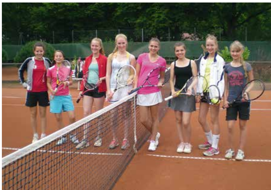
Juniorinnen A VfL E (links) Nienburg (rechts)