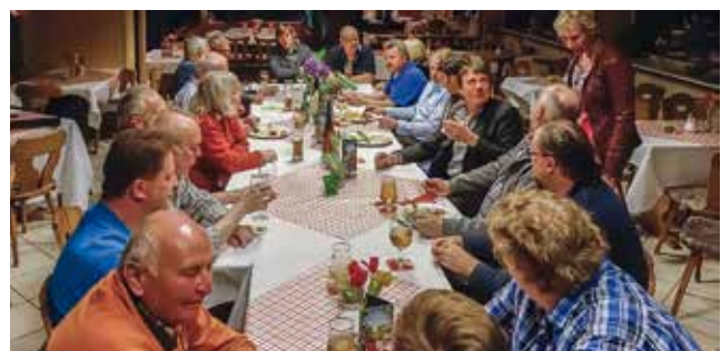
Nach dem Vergleichskampf trafen wir uns alle im Vereinsheim