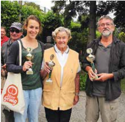
Die Sieger der Bäcker-Göing-Wanderpokale

Obwohl am Tag vorher der Bouleplatz noch unter Wasser stand, war das Wetter am Sonntag ideal zum Spielen, das fanden 40 andere Spielerinnen und Spieler auch. Die von Bäcker Göing gestifteten Sach-