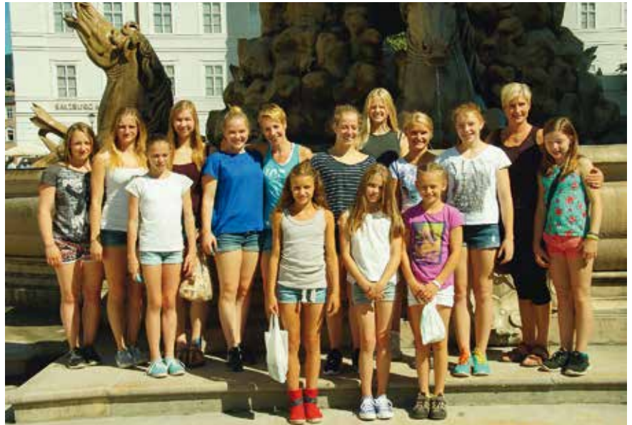
Ausflug nach Salzburg