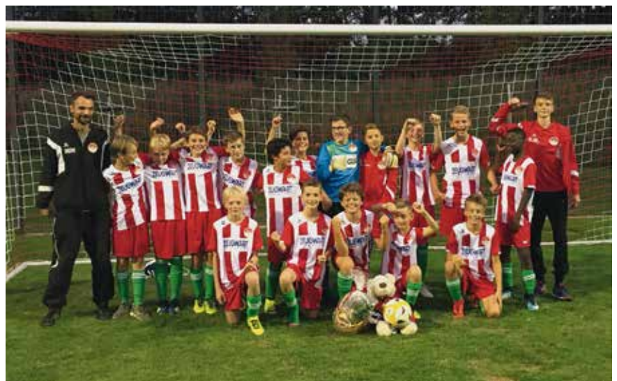
Sieg am Geburtstag des Trainers in Ricklingen mit dem Maskottchen: Unschlag-Bär