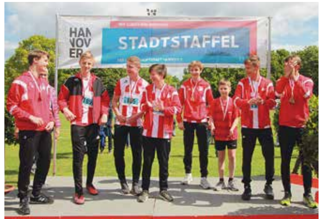
Männliche Fußballjugend der Wettkampfklasse U16 laufen den Leichtathleten weg und gewinnen mit großem Vorsprung Gold.