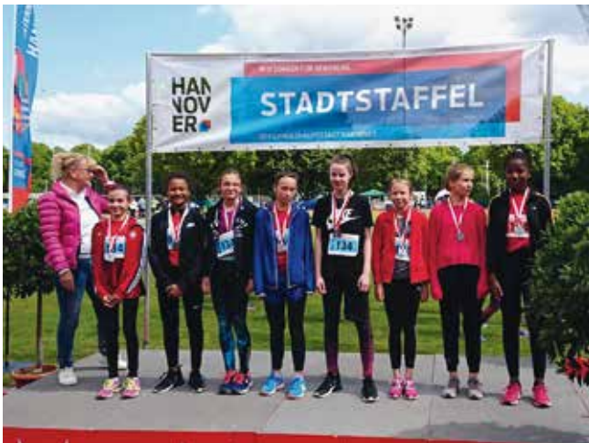
Weibliche Jugend U14 gewinnen Silber, Trainer: Maxi und Svenja