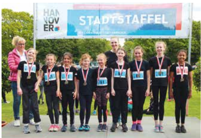
Die schnellen Turnmädels der Wettkampfklasse U12 freuen sich über die Goldmedaille.