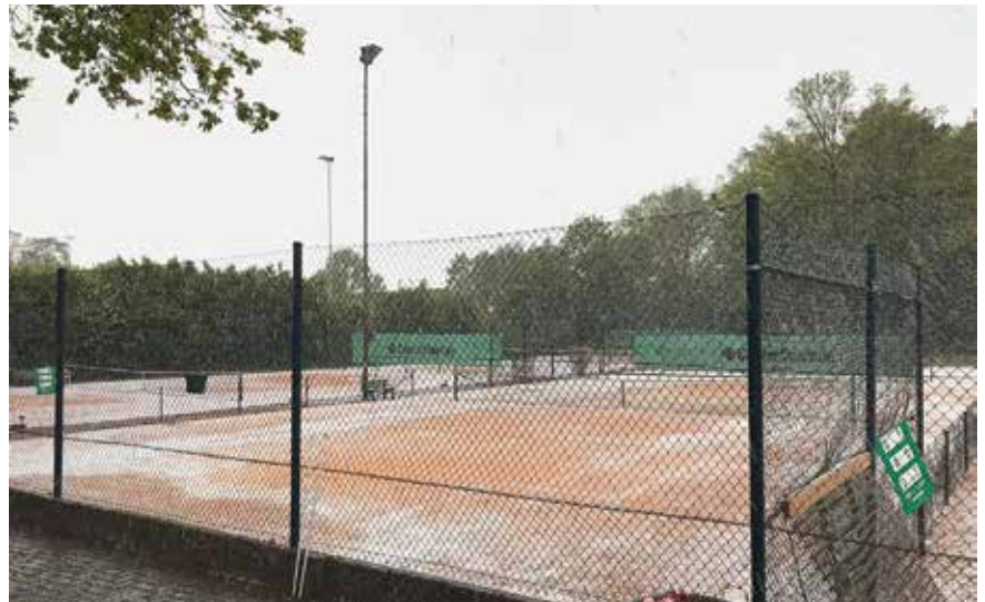
Hagelpause beim ersten Punktspiel der Herren 30 Anfang Mai auf der Anlage des TC Schwarmstedt

auf unserer VfL Eintracht-Anlage statt! Den ganzen Tag über werden hoffentlich viele Spielerinnen und Spieler (Damen + Herren, offene Klasse) aus den unterschiedlichsten Vereinen Hannovers und Umgebung um LK-Punkte kämpfen. Wir hoffen, dass neben den Aktiven auch einige Eintrachtlerinnen und Eintrachtler zum Zuschauen und Anfeuern auf die Anlage kommen! Für das leibliche Wohl ist gesorgt, es wird gegrillt! Insgesamt soll es in dieser Saison drei LK-Turniere auf unserer Anlage geben – die anderen beiden sind für den 10. August und den 14. September geplant.