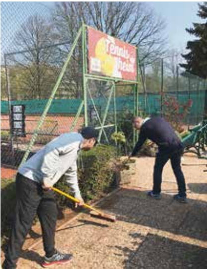
Frühjahrsputz auf unserer Tennisanlage am Samstag, den 6. April