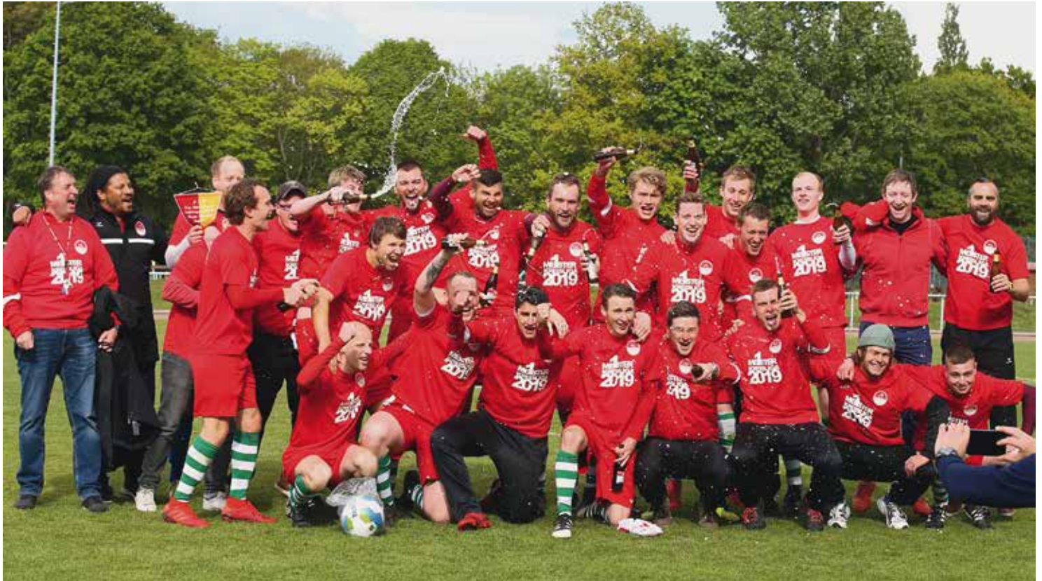
Die 1. Herren-Fußballmannschaft des VfL Eintracht Hannover jubelt gemeinsam über den vorzeitigen Aufstieg in die Bezirksliga (siehe Seite 27)