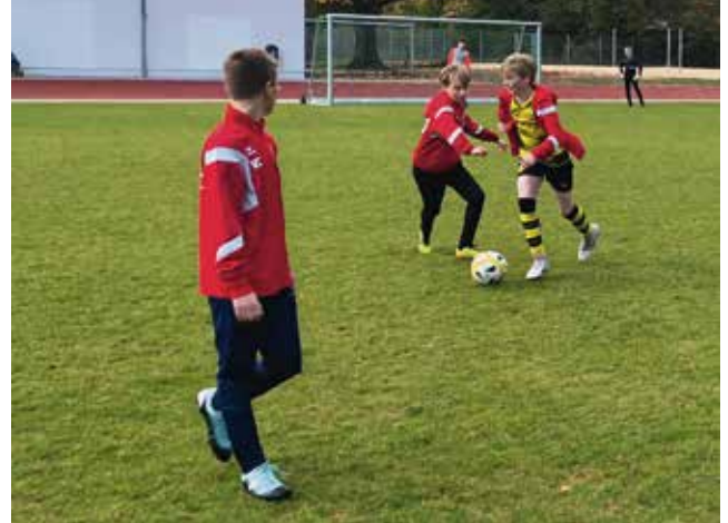
Voller Einsatz im Training

Es war eine wahre Mammutaufgabe, aus über 70 Kindern der neuen D-Jugendjahrgänge 2006 und 2007 ein Team für die neue D1 zusammenzustellen, das auf allen Positionen doppelt besetzt ist und dabei spielerisch, taktisch und technisch in der Kreisliga mithalten kann. Nach einer intensiven Vorbereitung starteten wir mit fünf Siegen in Folge in die Kreisligasaison. Der Vorsprung betrug bereits 6 Punkte auf Platz 2, als wir bei einem benachbarten Mittelfelder Verein spüren mussten, was es heißt, das gejagte Team zu sein. In einem turbulenten und hitzigen Spiel setzte es die erste Niederlage. Doch das war nur ein Ausrutscher, denn danach zeigten wir wieder die gewohnte Effizienz, wiederholt wurden dabei Spiele in den letzten Minuten entschieden – vielleicht auch, weil die Trainingsbeteiligung bei den (noch) freiwilligen Waldläufen so hoch ist. Dazu kann der Trainer aus dem starken Kader jederzeit Qualität ins Spiel bringen, um das Tempo hoch zu halten.