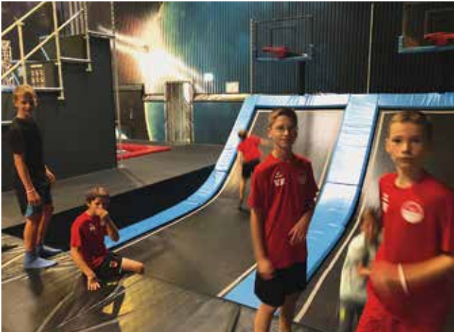
Alternative Trainingsmethoden: Körperbeherrschung ist im SuperFly gefragt