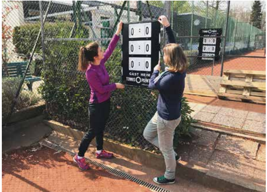
Auf all unseren fünf Plätzen haben wir neue Zähltafeln installiert.

Seit Anfang Mai laufen für unsere insgesamt dann sogar zwölf Jugend- und Erwachsenen-Mannschaften die Punktspiele. Lediglich unsere Junioren A III mussten wir aus personellen Gründen aus dem Spielbetrieb zurückziehen. Die aktuellen Ansetzungen unserer VfL Eintracht-Teams sind bei