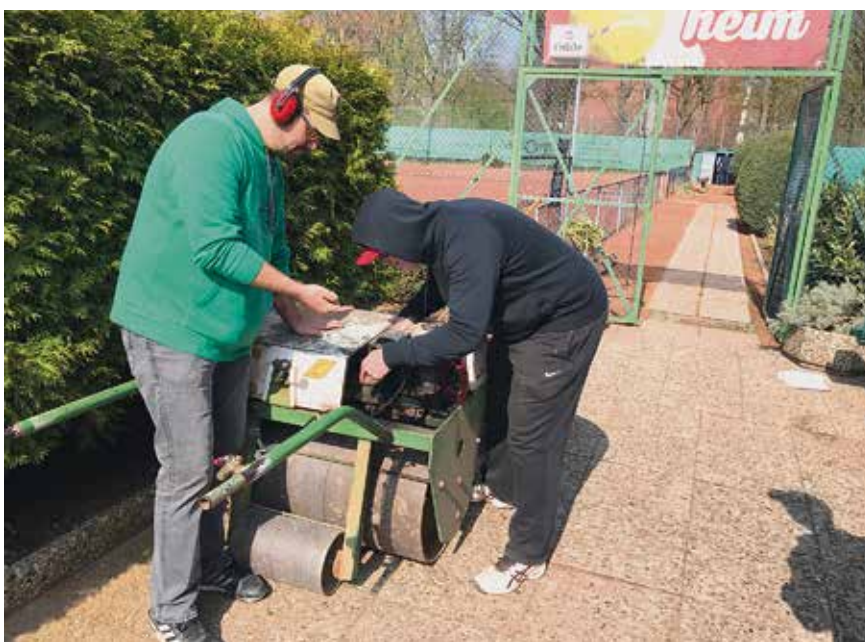
Die Walze hat zwar nicht immer gespurt, aber am Ende sind die Plätze doch rechtzeitig fertig geworden.