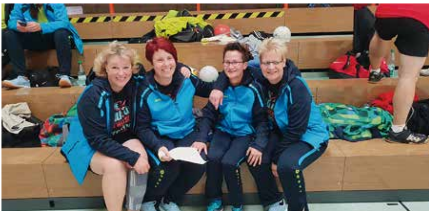
Ein tolles Team

Sottrum II deutlich „nach Hause gefahren“ werden. Der Spieltag endete mit positiven 6:4 Punkten.