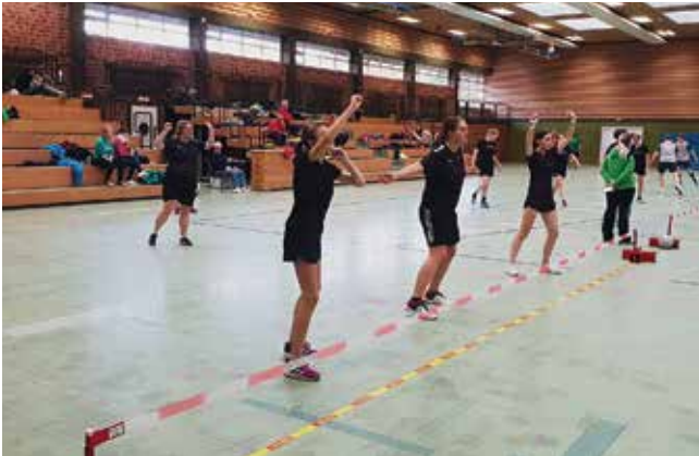
2. Mannschaft: Warten auf den Angriff