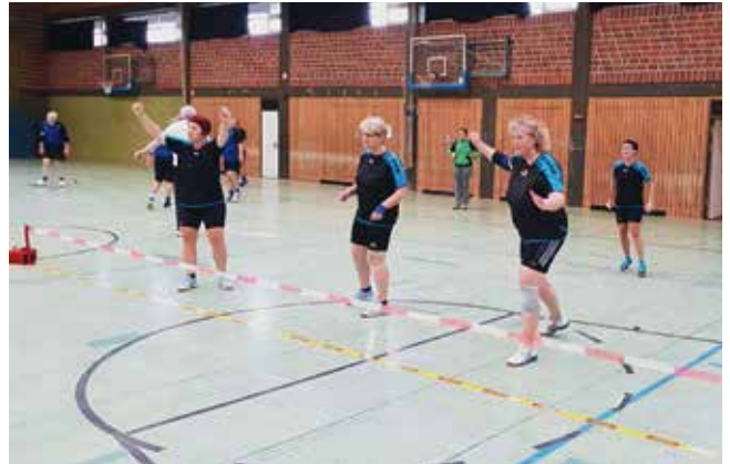
F40 spielt in der Landesliga mit

Am 13.10.2018 startete die neue Prellball Bundesligasaison in Baden (bei Achim).