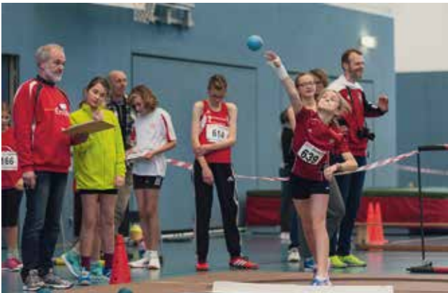
Nike beim Kugelstoßen