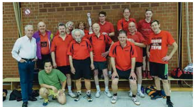
Es hat wieder einmal Spaß gemacht