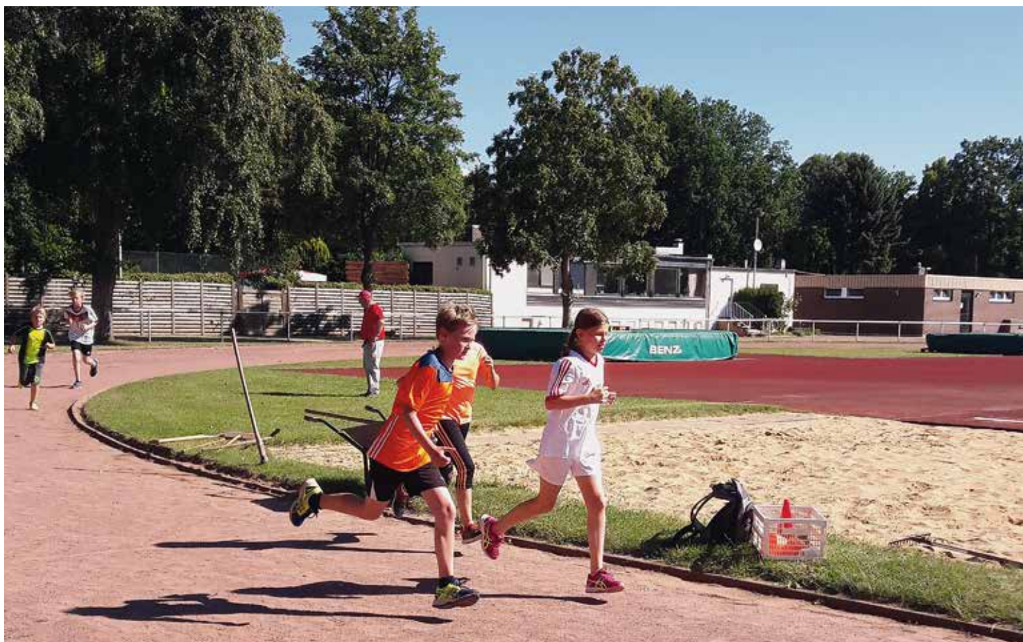
Der Frühling naht: Bald herrscht wieder reges Treiben auf der Anlage des VfL Eintracht an der Hildesheimer Straße

Einladung zur Jahreshauptversammlung Seite 9