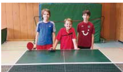
Unsere erfolgreichen Schüler

Für den Spielbetrieb der Erwachsenen hatten wir in der neuen Saison wieder sieben Mannschaften gemeldet. Wir starten von der 2.