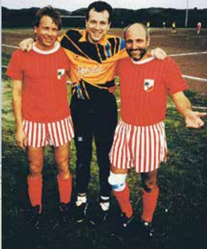
Wer sind diese heutigen Old Boys?

In den sonnigen Tagen von Ende September bis zum ersten Oktoberwochenende konnten wieder einmal einige Old Boys aus dem Bereich der Altherrenfußballer unseres Vereins einen Aufenthalt auf der Nordseeinsel Borkum genießen.