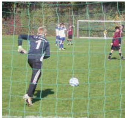
Abschlag: Spiel gegen Ahlem, Spielszene

Bis zum Ende der Saison hatte sich allein der SV Ahlem noch eine Restchance auf den Staffelsieg ge-