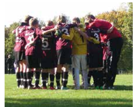
Wir sind ein Team: Spiel gegen Ahlem, Mannschaftskreis