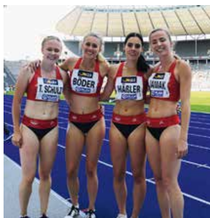
4 x 100 Meter Frauen-Staffel läuft Vereinsrekord

Die Zeit bedeutet Vereinsrekord. Der bisherige Rekord lag bei