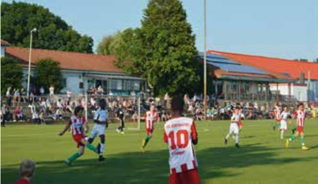
Das Spiel gegen Havelse wurde nach großem Kampf gewonnen