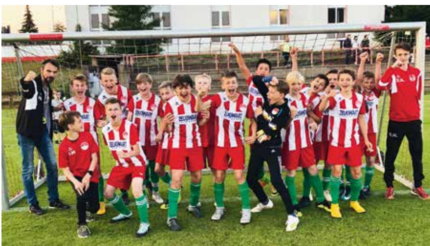
Die Freude nach Platz 3 kennt keine Grenzen