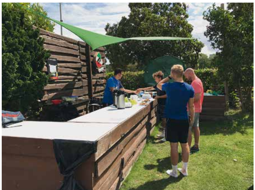
Würstchen, Salate, Kaffee und Kuchen - auch für das leibliche Wohl war gesorgt