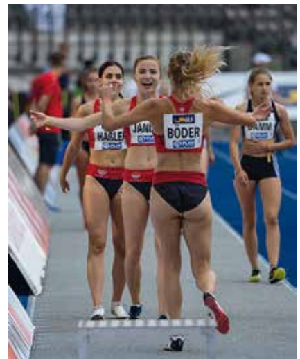
Freude über Vereinsrekord in der 4 x 100 m Staffel