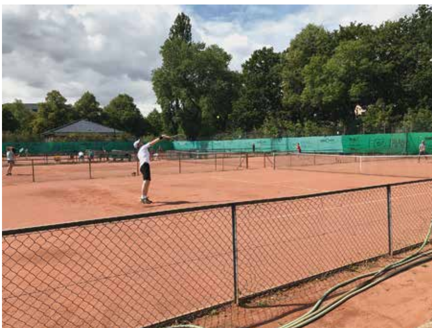
Fast 40 Spielerinnen und Spieler waren bei den 2. VfL Eintracht Hannover Open dabei